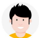
CPE / Personnels de vie scolaire