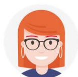
Enseignants / Documentalistes