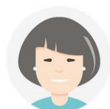
Personnels de direction / Administrateurs

L'accès à cette documentation est ouvert à l'ensemble des utilisateurs. Le contenu visible est différent selon le profil de l'utilisateur :